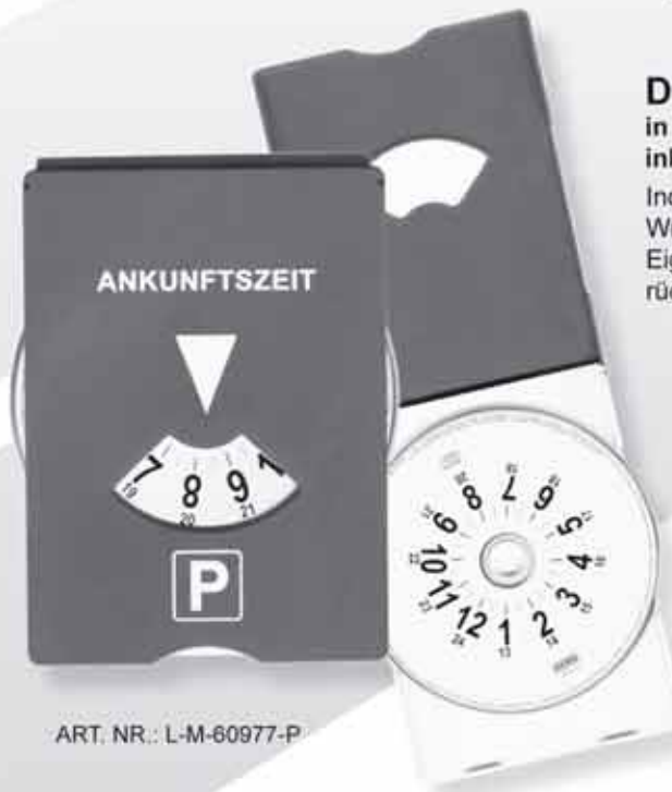
ART. NR.: L-M-60977-P

Die „neue“ Parkscheibe in Kunststoffverpackung inkl. Eiskratzer!